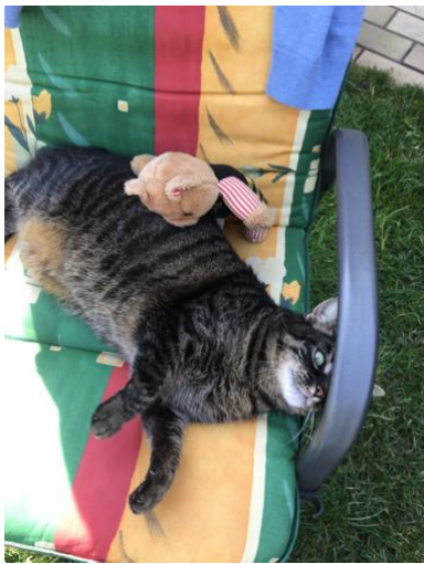
Ours spielt mit der Katze

Bearbeite mindestens 5 der Aufgaben von S.127 zu deinem gelesenen Buch/ deinen gelesenen Büchern!